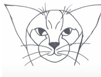
Te lage oorstand