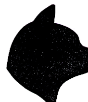
Correct profiel en kin