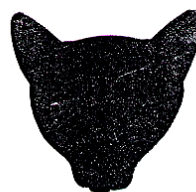
Pinch en geen dôme, veel te vlakke schedel