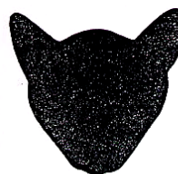
Mooi dôme maar oren volgen de lijn van de kaak niet