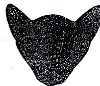
Correcte oorstand en mooi rond dôme

Burmees koptype met toestemming overgenomen; copyright The Rev. Gordon Briscoe